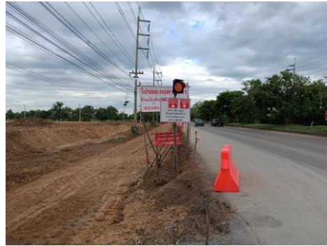
รูปที่ 19 กิจกรรมการสร้างทางเบียง