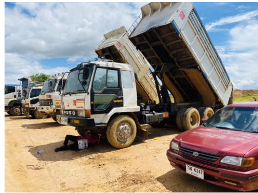
รูปที่ 20 การตรวจสอบ/ซ่อมบำรุงเครื่องยนต์